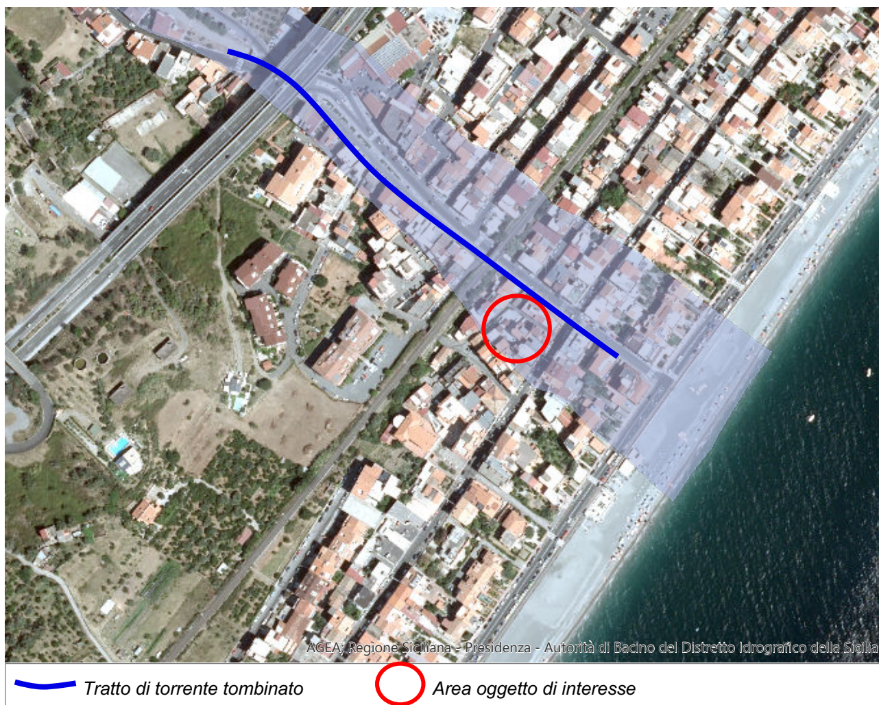
Fig. 1.1 - P.A.I. – Idraulica – Sito di attenzione

Nel Piano Assetto Idrogeologico (P.A.I.) - Idraulica della Regione Siciliana la porzione di terreno oggetto di tipizzazione urbanistica e l'intera particella 2494 del foglio 12 del Comune censuario di Santa Teresa di Riva ricadono in una fascia classificata come Sito di Attenzione del Torrente Porto Salvo.