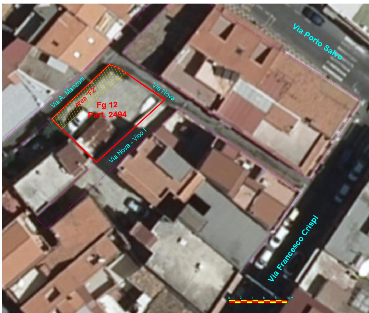
Fig. 1 – Planimetria della Part. 2494 Fg 12 e della striscia di terreno interessata

A tal proposito si rappresenta che il nel tratto in prossimità del terreno oggetto di variante urbanistica lo stesso torrente risulta tombinato. Per la precisione dalla sezione posta circa 20,00 ml a monte del ponte dell'autostrada A18 – Messina-Catania sino al bastione del lungomare il Torrente Porto Salvo risulta coperto da un impalcato stradale che definisce la sezione di deflusso delle acque. La misura della sezione, per tutto il tratto coperto lungo di circa 390 ml, risulta essere circa 7,00 m di larghezza per un'altezza minima di circa 2,25 m.